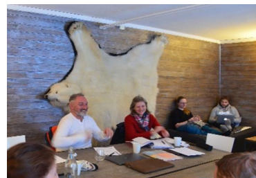
In Isfjord Radio